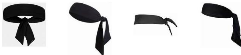
Figur 1 Eksempler på skjerfliknende hodeplagg

4-4 Utsagn. Det er ikke tillatt å bruke hodeplagg av typen skjerf som knyttes.