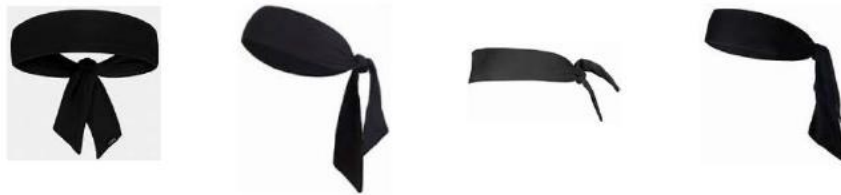
Figur 1 Eksempler på skjerfliknende hodeplagg

4-4 Utsagn. Det er ikke tillatt å bruke hodeplagg av typen skjerf som knyttes.